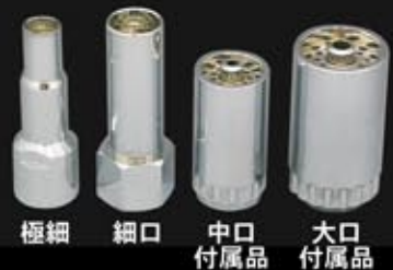
極細 細口 中口 大口 付属品 付属品

用途に合わせて使えるように、4種類の火口を用意。火口を揃える事により、細部のロウ付などからなまし作業までCAブローパイプで幅広い作業が可能です。