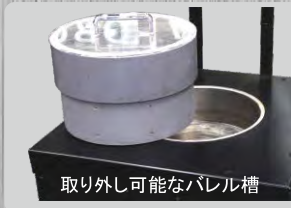
取り外し可能なバレル槽

インバーター制御で細かい設定が可能。回転の左右反転時間や速度、タイマーなど全ての設定が、正面パネルで可能。