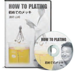
初めてのメッキ加工 DVDをプレゼント