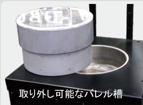
取り外し可能なバレル槽

この磁気バレル研磨機ギガントは加工物が多いお客様にはもってこいの強力大型磁気バレル研磨機です。独自の強力磁石配置とタッパーの淵に柱を立てる事によりバレルピンが通常の物よりよく跳ね上がる用に設計されています。しかも反転機能もタイマー制御で装備されていますのでお好みの回転時間に合わせて逆回転致します。